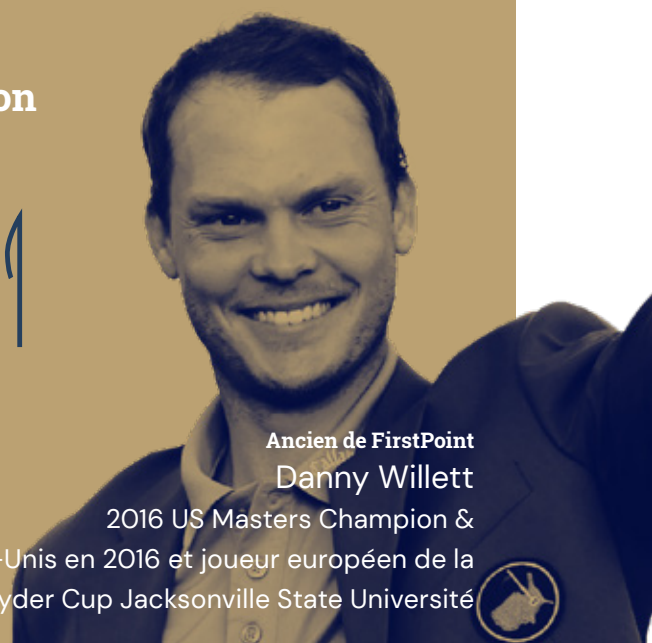
Ancien de FirstPoint Danny Willett

2016 US Masters Champion & Champion des États-Unis en 2016 et joueur européen de la Ryder Cup Jacksonville State Université